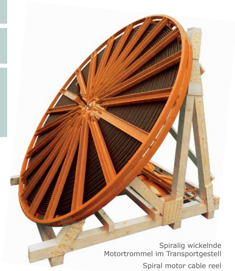
Spiralig wickelnde Motortrommel im Transportgestell

Nennen Sie uns Ihre Anforderungen und wir erstellen Ihnen ein umfassendes, qualifiziertes Angebot.